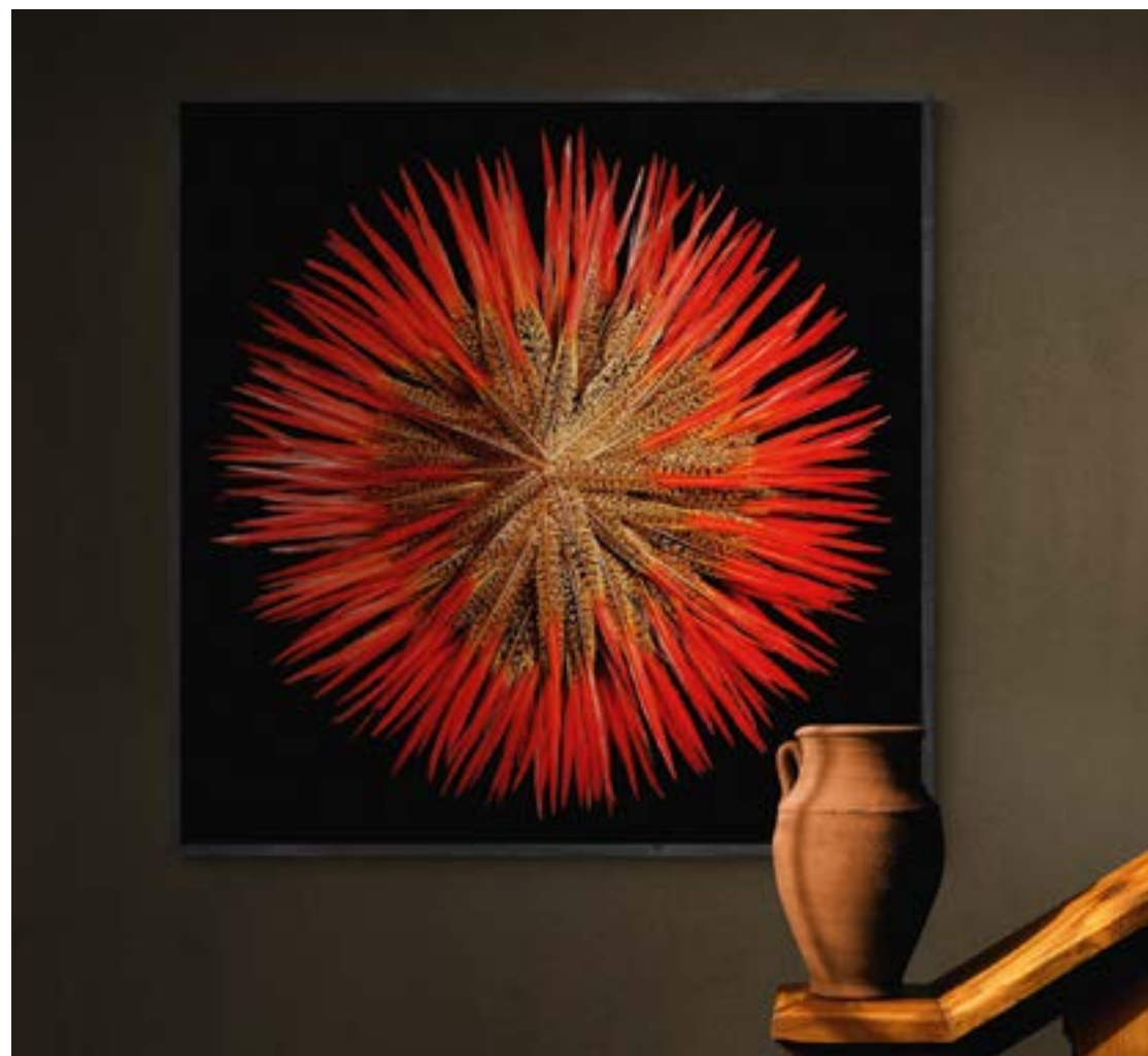
LINKS Colors of nature 125 x 125 cm.