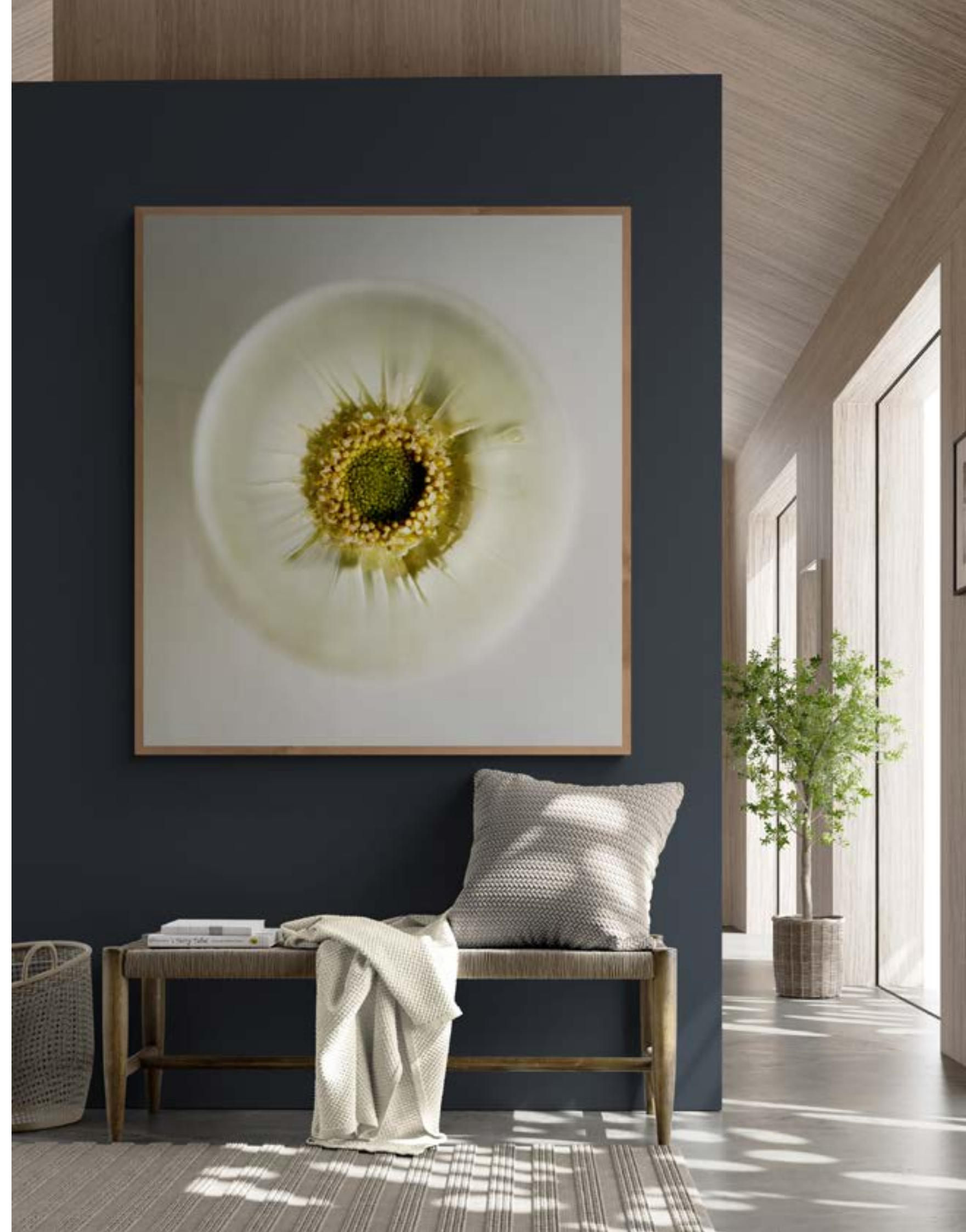
RECHTER- PAGINA The Great White 115 x 125 cm.